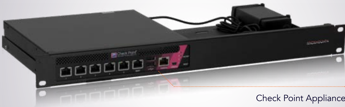
Check Point Appliance

(altura x largura x profundidade) 1.73 x 18.98 x 8.54 in